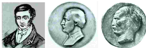
Αθ. Τσακάλωφ, Εμμ. Ξάνθος, Νικ. Σκουφάς

Εμμανουήλ Ξάνθο στις 14 Σεπτεμβρίου του 1814 στην Οδησό, με στόχο την απελευθέρωση του ελληνικού έθνους. Μέσα σε λίγα χρόνια κατόρθωσαν να μνησούν στη Φιλική Εταιρεία τους περισσότερους από τους μετέπειτα ήρωες της Επανάστασης. Καλλιέργησαν τις ιδέες της ελευθερίας και προετοίμασαν το έδαφος για την εξέγερση. Ο Αθ. Τσακάλωφ έζησε μερικά χρόνια στο Παρίσι, όπου είχε έλθει για να σπουδάσει ιατρική και όπως φαίνεται ήλθε σε επαφή με τους φιλελεύθερους ελληνικούς κύκλους που είχαν ιδρύσει, το 1809, το «Ελληνόγλωσσο Ξενοδοχείο», μυστική οργάνωση, που θεωρείται πρόδρομος της Φιλικής Εταιρείας. Γύρισε στη Ρωσία το 1813.