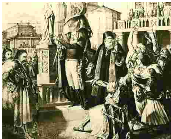
Στις 24 Φεβρουαρίου του 1821 στο Ιάσιο της Μολδαβίας, ο Αλέξανδρος Υψηλάντης κηρύσσει την έναρξη του αγώνα για την ελληνική ανεξαρτησία

Θα γιορτάσουμε σε λίγες μέρες την 185 η επέτειο της Εθνεγερσίας του 1821. Καθιερώθηκε και εορτάζεται η 25 η Μαρτίου σαν επίσημη ημέρα έναρξης του ένοπλου αγώνα ενάντια στην Οθωμανική αυτοκρατορία, γιατί ήταν η πιο κοντινή με τη ιστορικά αποδεδειγμένη πρώτη πολεμική νίκη εναντίον των Τούρκων στον Ελλαδικό χώρο. Συγκεκριμένα τη απελευθέρωση της Καλαμάτας στις 23 Μαρτίου 1821 από τον Γέρο του Μωριά, το Πετρόμπεη Μαυρομιχάλη και τους Μανιάτες, που είχαν εξεγερθεί από τις 21 Μαρτίου και άρχισαν τη πολιορκία της πόλης στις 22 Μαρτίου. Η ημερομηνία της 25 ης Μαρτίου συνδέει την έναρξη της επανάστασης με τον Ευαγγελισμό της Θεοτόκου, με το χαρμόσυνο μήνυμα της επερχόμενης Λύτρωσης όπως το διδάσκει η Ανατολική Ορθόδοξη Εκκλησία. Έτσι τα δύο γεγονότα συνδέονται συμβολικά μαζί.