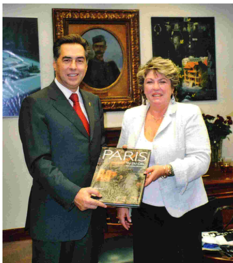
Ο δήμαρχος Θεσσαλονίκης κ. Βασίλειος Παπαγεωργόπουλος με τη κα Σέτα Θεοδορίδου, γεν. γραμματέα της Κοινότητας

Ο Δήμαρχος της Θεσσαλονίκης, κ Βασίλειος Παπαγεωργόπουλος καθώς και ο αντιδήμαρχος