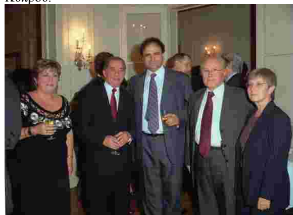
Η κα Σ. Θεοδορίδου, ο πρόεδρος Τάσος Παπαδόπουλος, Ε. Μαυρομμάτης, Α. Τσαπής και Ρ. Τσαπή

Η επίσημη επίσκεψη του προέδρου της Κυπριακής Δημοκρατίας στο Παρίσι στις 4 και 5 Νοεμβρίου 2005 έδωσε την ευκαιρία να ακουστούν στο γαλλικό χώρο, για ακόμη μία φορά, τα προβλήματα που ταλανίζουν τη Κυπριακή Δημοκρατία και ιδιαίτερα να τονιστεί το γεγονός ότι η Τουρκία κατέχει, παραβιάζοντας τους κανόνες του διεθνούς δικαίου, το βόρειο τμήμα της Κύπρου.