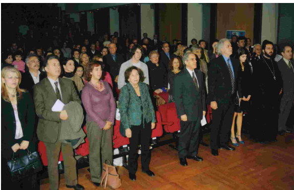
Ψάλλοντας τον Εθνικό Ύμνο