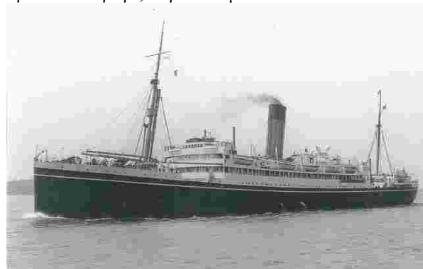
« Mataroa »

το «Ματαρόα», πλοίο αγγλικό, τέως εμπορικό που έγινε οπλιταγωγό, λόγω πολέμου.