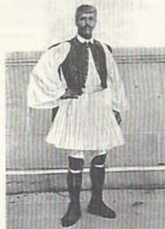
Ο πρώτος νικητής μαραθωνοδρόμος, Σπύρος Λούκας