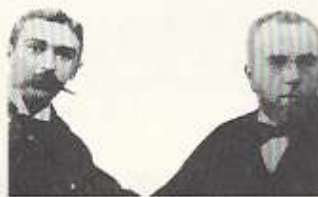
Ο βαρόνος de Coubertin(αριστερά)και ο Δημήτριος Βικέλας(δεξιά)

Η αναβίωση των Ολυμπιακών Αγώνων με τη σημερινή τους, πάνω κάτω μορφή, είναι αποτέλεσμα της επίμονης προσπάθειας του βαρόνου de Coubertin. Ο λόγιος έμπορος Δημήτριος Βικέλας έγινε ο πρώτος πρόεδρος της ΔΟΕ χωρίς να έχει μεγάλη σχέση με τον αθλητισμό.