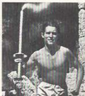
Κώστας Κονδύλης, ο πρώτος λαμπαδηδρόμος των Ολυμπιακών Αγώνων (1936)

που το απέκλειε ο βαρόνος κατηγορηματικά, η συμμετοχή των γυναικών.