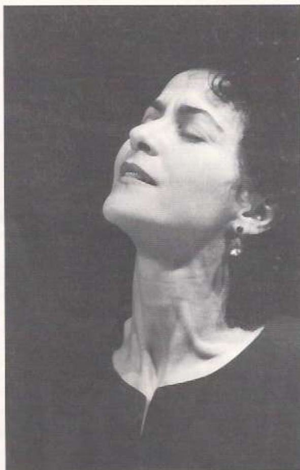
Angélique Ionatos : ...και η φωνή περνάει από την άμεση συγκίνηση.

Έχω μια έμφυτη αντιπάθεια στο γεγονός ότι μπορώ να αντιπροσωπεύω κάτι άλλο από εμένα. Θα έλεγα μάλλον μια αντιπάθεια η οποία δεν είναι τωρινή, είναι παλιά. Έχω μια αντιπάθεια για τους ανθρώπους που ξαφνικά γίνονται φορείς ορισμένων πραγμάτων που ίσως στην αρχή δεν τα θέλησαν και μετά φυλακίζονται κάπως από αυτή την ευθύνη. Εγώ τη μόνη φιλοδοξία που έχω είναι να φτάσω όσο το δυνατόν πιο κοντά σ'αυτό που μ'ενδιαφέρει να εκφράσω. Δηλαδή όσο πιο τιμια